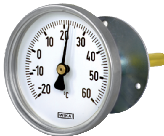
Termometr bimetaliczny model A48.10.080